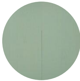
SALT LAKE GREEN