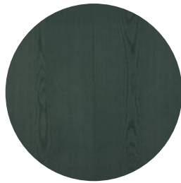
RUBIO MONOCOAT GREEN