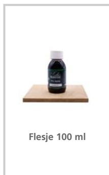
Flesje 100 ml