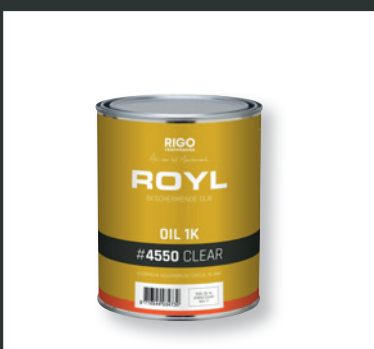
ROYL OIL 1K