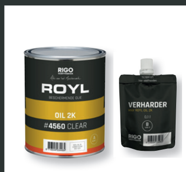
ROYL OIL 2K